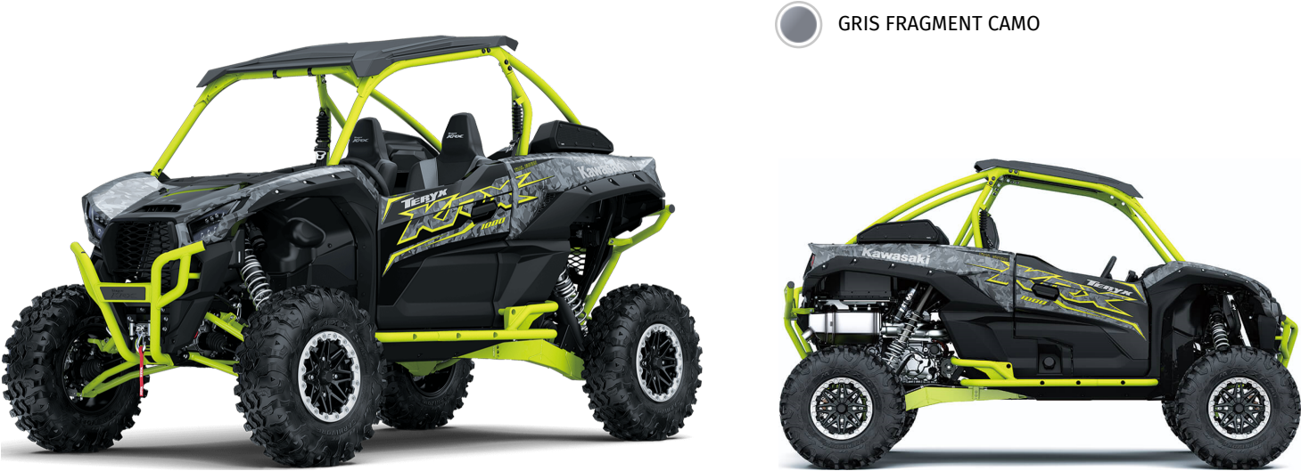
GRIS FRAGMENT CAMO